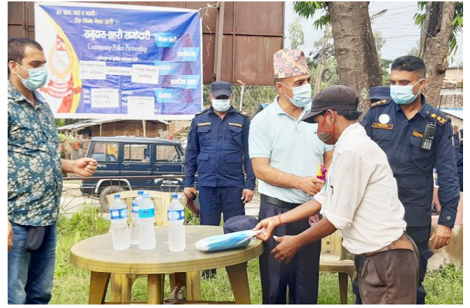
कार्यक्रम तथा सप्तरी जिल्लामा गरीएको निषेधाज्ञा र मास्क लगाणे सम्बन्धि जारी गरिएको सुचना र कानुनी व्यवस्थाको सम्बन्धमा जनचेतना दिइएको छ ।